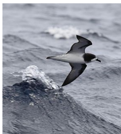
Pétrel de Gould

A noter que de nombreux particuliers ont également emmenés au Parc Zoologique et Forestier les oiseaux marins échoués sur Nouméa.