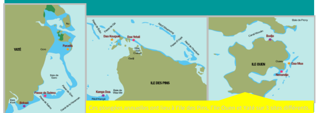
Ces plongées annuelles ont lieu à l'Ile des Pins, Ile Ouen et Yaté sur 3 sites différents.